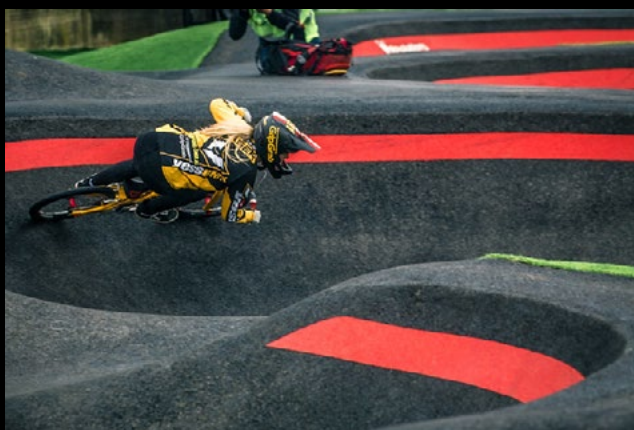
Profi auf dem Pumptrack