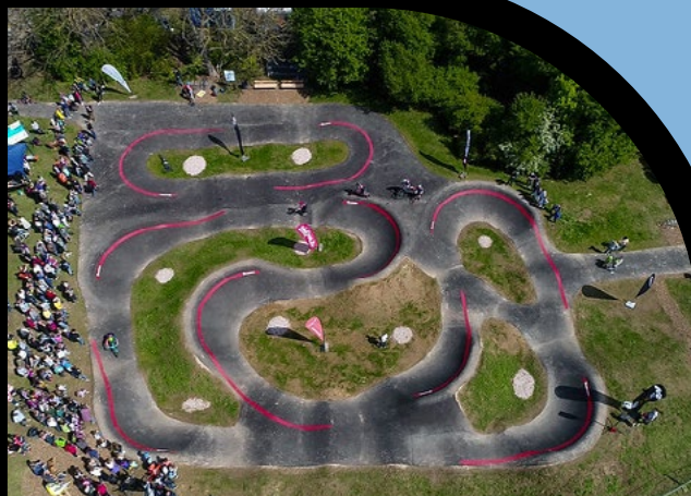
Ein Pumptrack aus der Vogelperspektive

Gemäss dem Bundesamt für Sport (BASPO, 2014) ist Radfahren neben Wandern, Schwimmen und Skifahren eine der beliebtesten und häufigsten Sportarten in der Schweiz. Zählt man das Mountainbiken mit hinzu, steht das Velo sogar ganz an der Spitze. Die Sportinfrastruktur trägt der Bedeutung des Velos jedoch noch zu wenig Rechnung. Ein asphaltierter Pumptrack lässt sich zudem auch mit Inline Skates, Skateboards, Kickboards, Laufrädern etc. nutzen. Asphalt birgt ausserdem einen geringen Unterhaltsaufwand und der Pumptrack kann ganzjährig und witterungsunabhängig genutzt werden. Ob Eltern mit ihren Kindern, Lehrpersonen mit einer Schulklasse, Mountainbike-Anfänger oder Skate-Profi ein Pumptrack übt auf alle eine riesige Anziehungskraft aus. Durch diese breite Zielgruppe ist ein Pumptrack nicht nur ein wirkungsvolles Instrument der Bewegungsförderung, sondern auch ein Treffpunkt der Gemeinde.