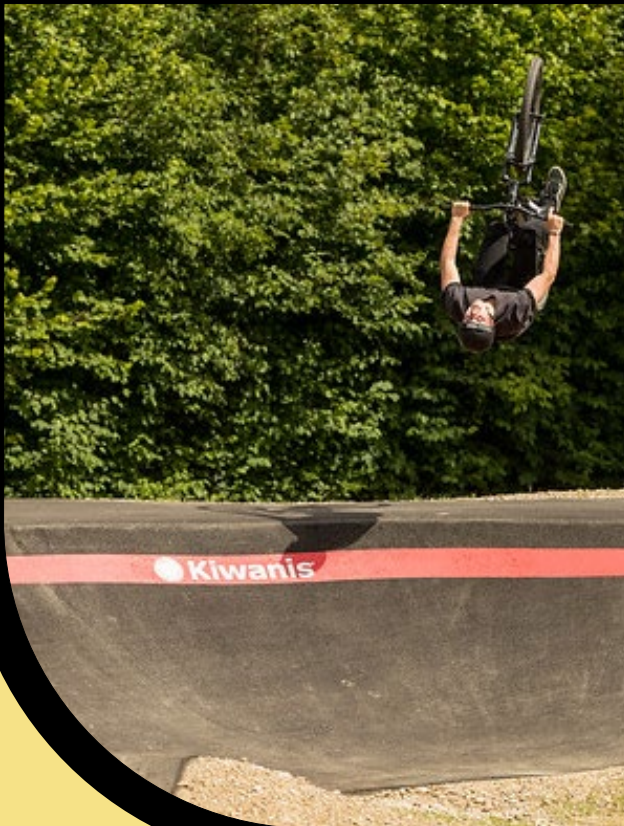
Bsp. Logo auf Begrenzungsstreifen

Die Logos werden dauerhaft mit Asphaltfarbe auf den Track gemalt und bleiben während der gesamten Nutzungsdauer dort stehen. Auch die Bandenwerbung zeigt während der gesamten Nutzungsdauer von min. 10 Jahren Ihr Logo.