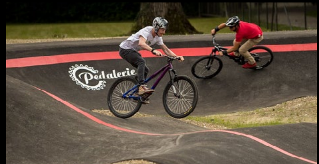
Bsp. Logo auf Steilwandkurve