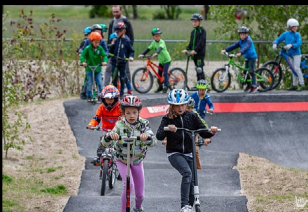
Kinder auf dem Pumptrack