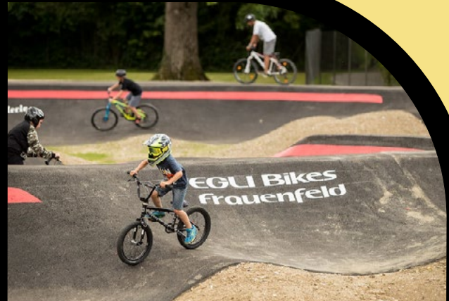
Bsp. Logo auf Track