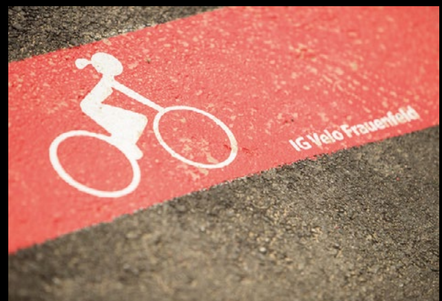
Bsp. Logo auf Begrenzungsstreifen